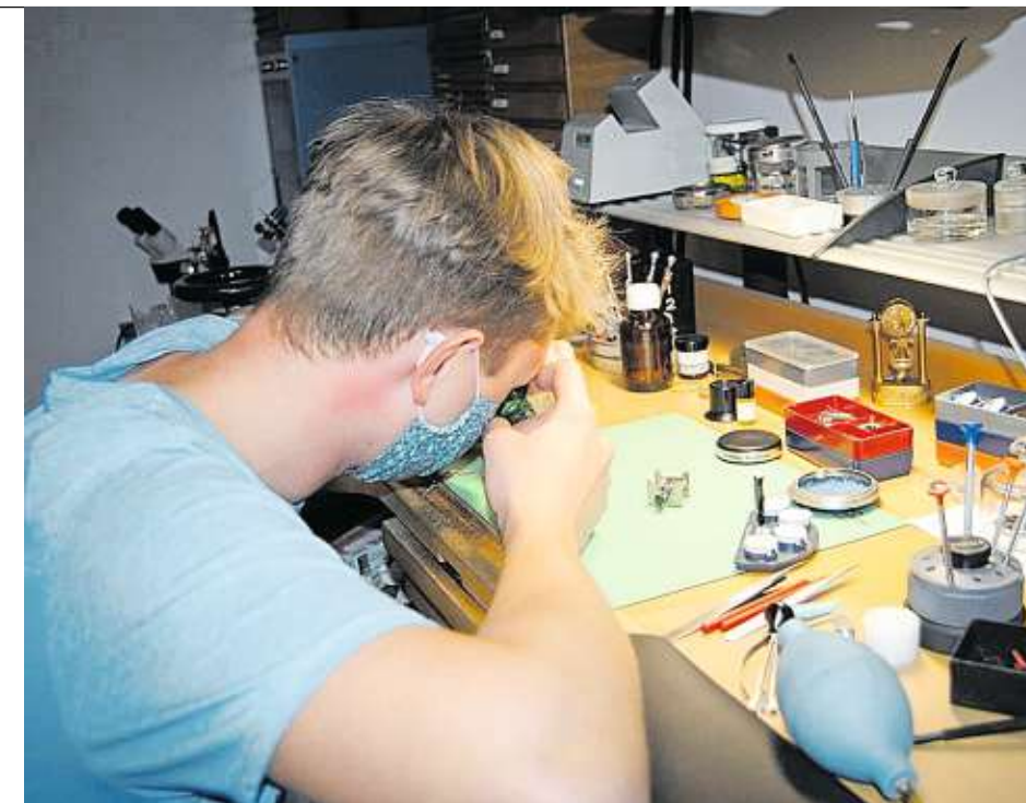
Konzentriert arbeitet der junge Uhrmachermeister an einer seiner Werkbänke